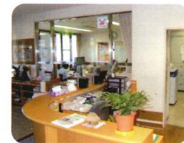
事務所 どんな事でも お気軽にお問い合わせ下さい。

新宮偕同園で あかるい暮らし 利用者の方々が快適に過ごせるサポートをいたします。