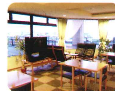
ケアハウス 笑顔で毎日をお過ごし頂けるよう新しい ライフプランを御提案いたします。