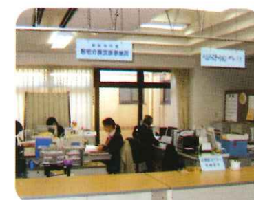
居宅介護支援事業所 ヘルパーステーションやわらぎ 「笑顔・安心・信頼」を モットーに対応しています。