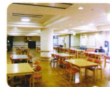
養護老人ホーム 利用者の方々が楽しみながら自立して いけるよう工夫しています。