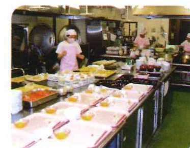
給食 素材を吟味し、当園給食にて調理した 食事を提供しております。